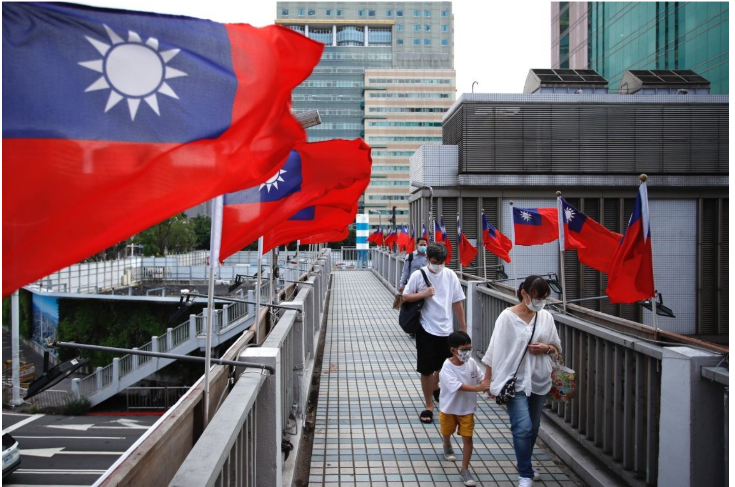
Des drapeaux taïwanais flottent à l'approche de la fête nationale du 10 octobre 2022 sur cette île de 24 millions d'habitants. Les tensions augmentent dans le détroit de Taïwan alors que Pékin multiplie les exercices militaires et prône la réunification de Taïwan avec la Chine continentale

Bien que le rapport n'apporte aucune preuve concrète et admette à juste titre que cette description de l'état d'esprit de Xi est purement spéculative, il utilise néanmoins cette affirmation comme un élément important de son argumentation en faveur d'une multiplication par deux de toutes les formes de dissuasion tout en négligeant les mesures crédibles visant à rassurer la Chine.