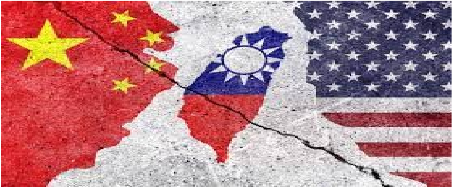
Taiwan entre la Chine et les USA

https://responsiblestatecraft.org/2023/06/29/how-a-reckless-report-could-increase-the-chance-of-a-crisis-with-china/