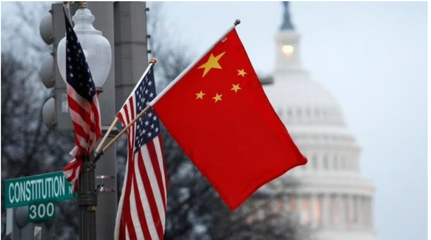
Le drapeau de la République populaire de Chine et le drapeau américain flottent sur un lampadaire le long de Pennsylvania Avenue près du Capitole des États-Unis à Washington pendant la visite d'État du président chinois Hu Jintao, le 18 janvier 2011

Selon les auteurs, le sort de Taïwan «déterminera en grande partie la capacité de l'armée américaine à opérer dans la région». Et pourtant, la valeur stratégique de Taïwan concernant la position militaire mondiale des États-Unis en Asie est un point qui fait débat parmi de nombreux analystes et universitaires, souvent sans qu'il puisse être apporté de conclusions décisives.