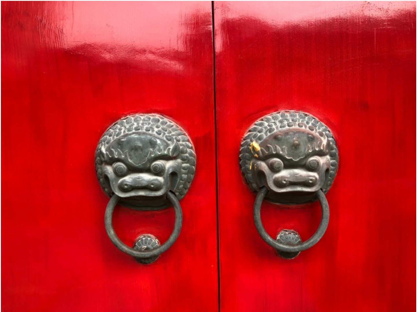
Les deux portes