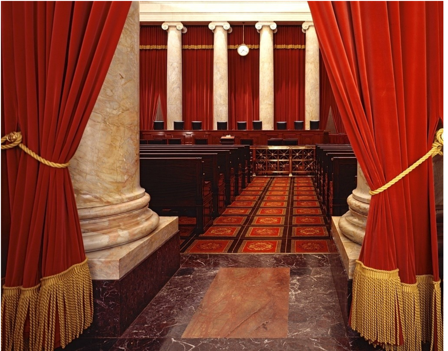
La Cour suprême des États-Unis.